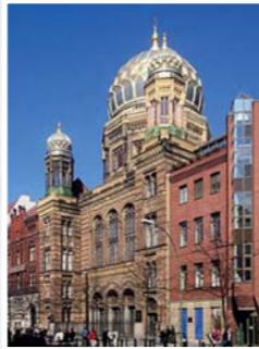
Neue Synagoge Berlin